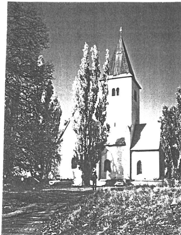
KOSTEL SV. JAKUBA NA CHVOJENU ZBLÍZKA. SDRUŽENÁ OKÉNKA NA VĚŽI DOKAZUJÍ, ŽE SE ZDE NALEZNOU I ZBYTKY ROMÁNSKÉHO SLOHU.